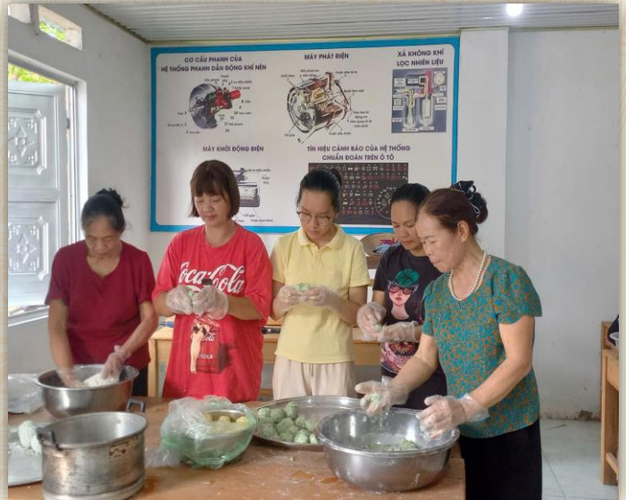
Truyền dạy cho thế hệ trẻ biết cách làm các loại bánh truyền thống

Đặc biệt chi bộ tổ chức truyền dạy cho thế hệ trẻ trong tổ dân phố cách gói bánh chưng, bánh lá khúc, bánh trôi, bánh gio, bánh cóoc mò, xôi ngũ sắc, rượu nếp cái, bánh dày,... trong các dịp lễ, tết, qua đó thế hệ trẻ được hiểu về nguồn gốc, ý nghĩa của từng loại bánh gắn với phong tục, tập quán của dân tộc. Bên cạnh đó, chi bộ đã tổ chức lớp truyền dạy đàn tính, hát then cho thanh, thiếu niên trong chi bộ. Qua đó góp phần bảo tồn, gìn giữ và phát huy di sản văn hóa, giúp các giá trị văn hóa được lưu truyền bền vững, tránh nguy cơ mai một trong đời sống hiện đại.