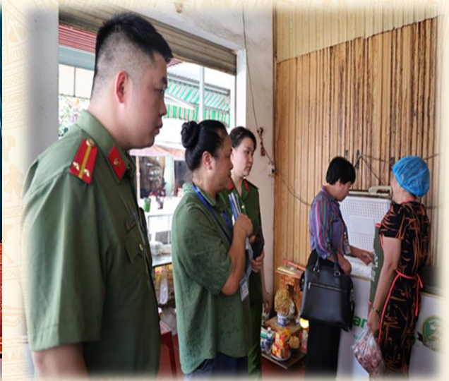
Phường Đức Xuân tăng cường kiểm tra an toàn thực phẩm