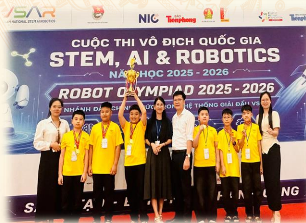
Học sinh trường Tiểu học Đức Xuân giành Giải siêu cúp, giải nhất, cúp vô địch và Huy chương vàng tại Chung kết Quốc gia cuộc thi STEM, AI & Robotics