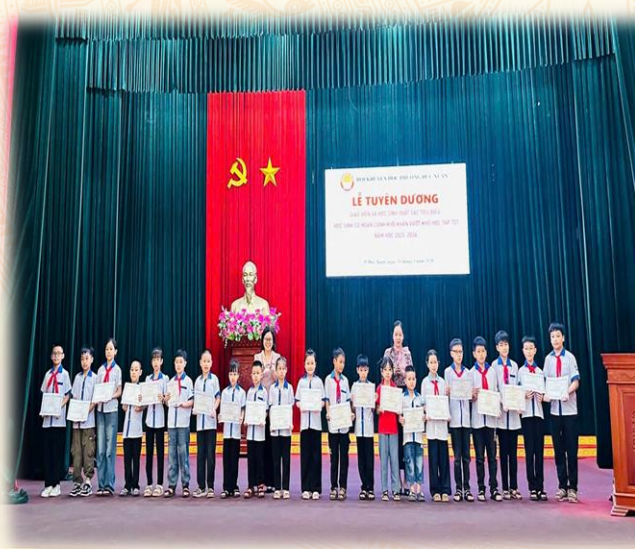
Phường Đức Xuân tổ chức tuyên dương giáo viên và học sinh xuất sắc tiêu biểu, học sinh có hoàn cảnh khó khăn vượt khó học tốt năm học 2025 - 2026