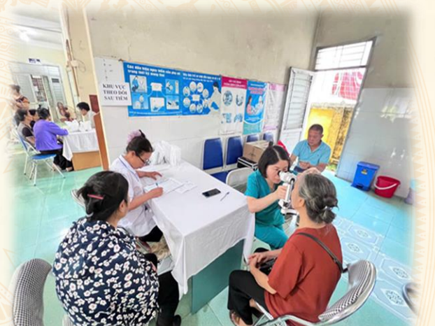
Trạm Y tế phường Đức Xuân tổ chức khám, tư vấn sức khỏe cho Nhân dân