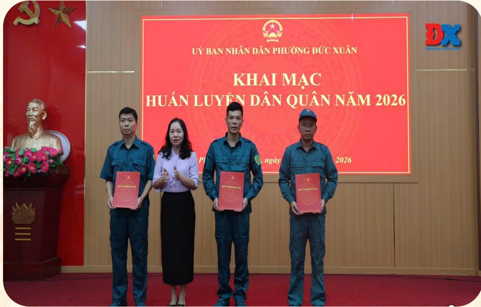
Phường Đức Xuân khai mạc huấn luyện Dân quân năm 2026