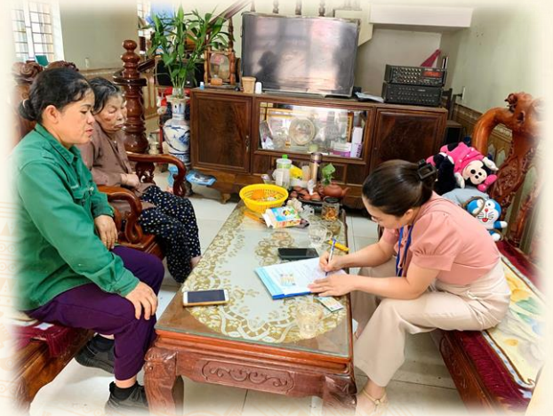
Phường Đức Xuân triển khai hiệu quả mô hình “hỗ trợ người dân yếu thế tiếp cận dịch vụ công trực tuyến”