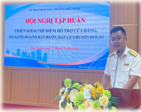
Phường Đức Xuân tổ chức hội nghị tập huấn, hỗ trợ triển khai các ứng dụng số phục vụ kê khai, nộp thuế điện tử