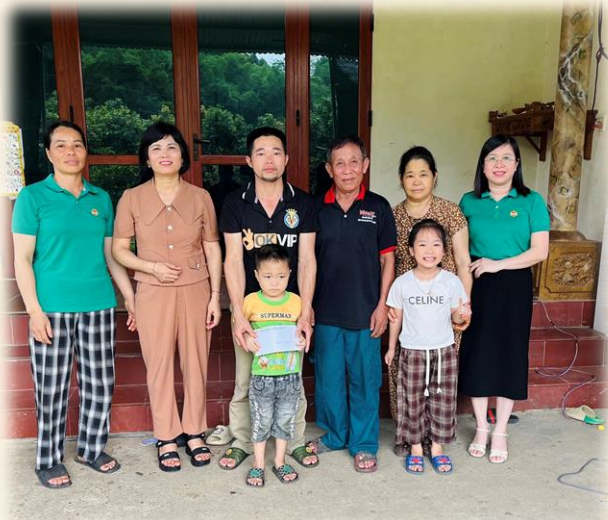
Hội Nông dân phường thăm, tặng quà trẻ em là con hội viên nông dân hộ nghèo, hộ cận nghèo