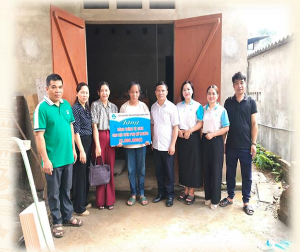
Hội LHPN phường hỗ trợ xây dựng nhà vệ sinh cho hội viên phụ nữ nghèo