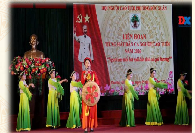
Hội người cao tuổi phường Đức Xuân tổ chức Liên hoan tiếng hát dân ca