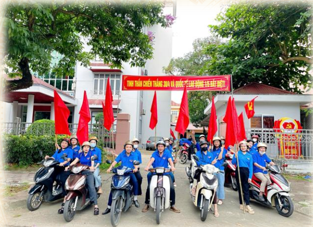
Đoàn phường Đức Xuân tổ chức tuyên truyền lưu động an toàn thực phẩm