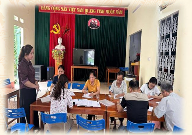
Ban Thanh tra nhân dân phường Đức Xuân giám sát việc thu, quản lý sử dụng một số loại quỹ huy động của các tổ chức và Nhân dân đóng góp