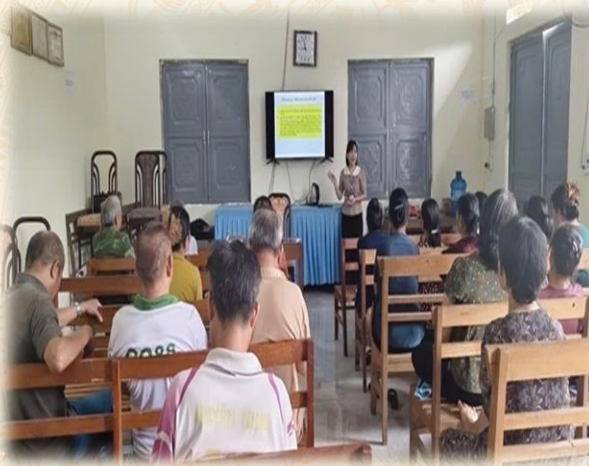
Phường Đức Xuân tổ chức tập huấn kỹ thuật sản xuất hữu cơ vụ mùa